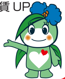
草津市社会福祉協議会 キャラクター「ふくちゃん」